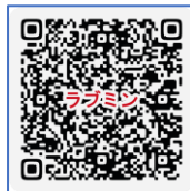
作品応募の詳細はこちらから