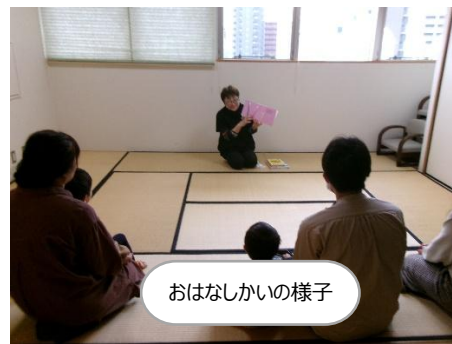
おはなしかいの様子