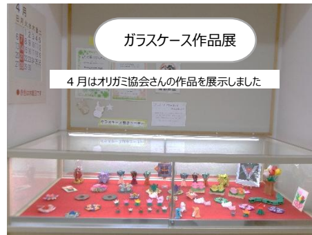
ガラスケース作品展